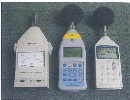
●講演内容2-騒音計、測定、実音経験