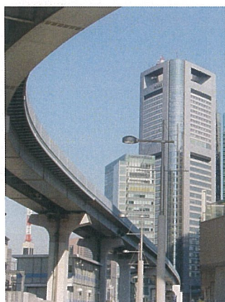
●講演内容1-騒音の測定