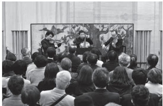
ヴァイオラ：豊嶋泰嗣 ヴァイオリン：三浦文影 チェロ：富岡兼太郎 東京国立博物館 平成館ラウンジ