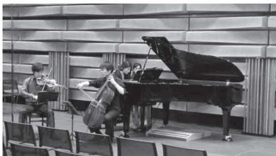
バイオリン：三上亮 チェロ：金子鈴太郎 ピアノ：須藤千晴 TWILIGHT CONCERT リハーサル風景