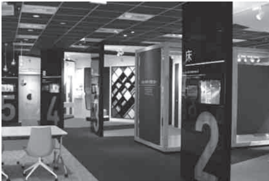
写真6 コラボレーションスタジオ

「コラボレーションスタジオ」では、音に限らず DAIKEN独自の技術や素材が展示されていました。