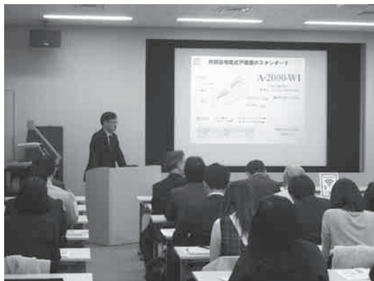
写真1 せっこう製品の説明風景

ショールームは1階と2階が展示ルームとなっており、2階に音響体験室があります。今回の見学会は、まず、せっこうボードの基本情報の説明が20分ほどありました。「せっこうは、何故、耐火性があるか」から「様々なせっこうボード製品」についてビデオをまじえて詳しい説明がありました。