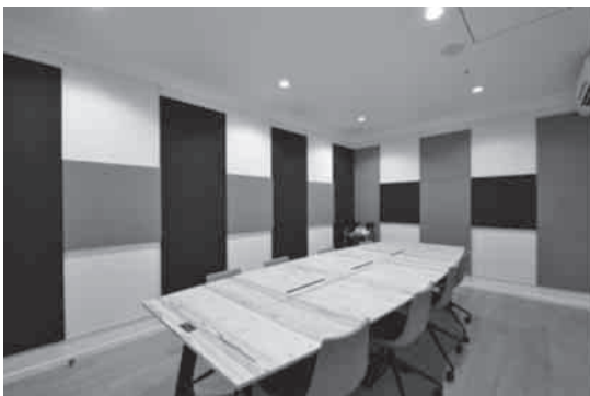
写真7 反響部屋(OFF TONE設置)

反響部屋では、DAIKEN吸音製品の「OFF TONEマグネットパネル」を1枚ずつ設置し、吸音を施す事での様に室内音響が変化するかを体感を行いました。