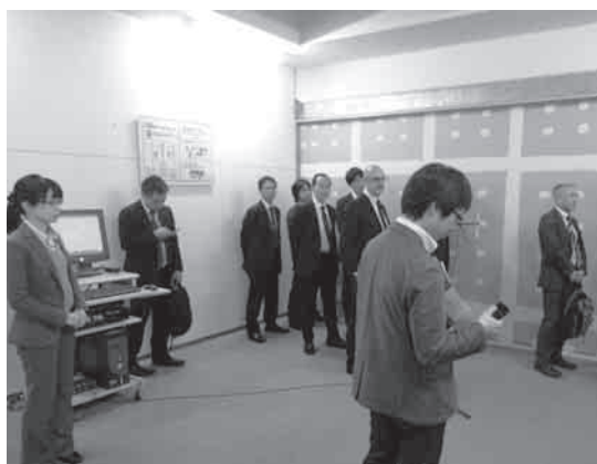
写真2 音響体験室の様子

音響体験室では、TLD-56である「A2000 WI」の壁について、音源側と受音側の遮音室、それぞれに入り、聞こえる音を体験しました。また、TLD-40、45、50、56の遮音壁での聞こえ方の違いも体感しました。