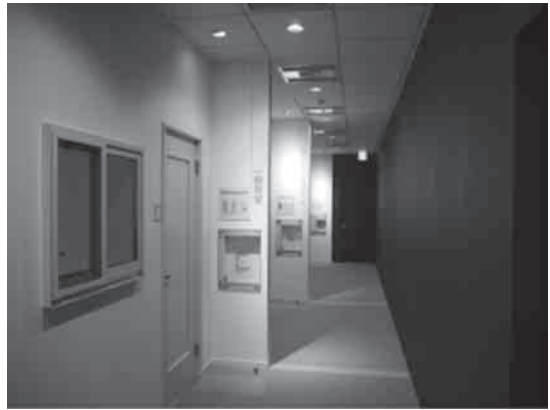
写真4 サウンドショールーム

今回は、住宅用防音室の性能比較体感ができる「サウンドショールーム」を中心に見学を行いました。サウンドショールームは、「非防音」「スタンダード★★防音(遮音性能40 dB程度/500 Hz時)」「プレミアム★★★防音(遮音性能50 dB程度/500 Hz時)」の3種類のお部屋を設置しており、室内で同じ音量で音を流した時、それぞれの部屋でどの程度の音が洩れるかを体感しました。