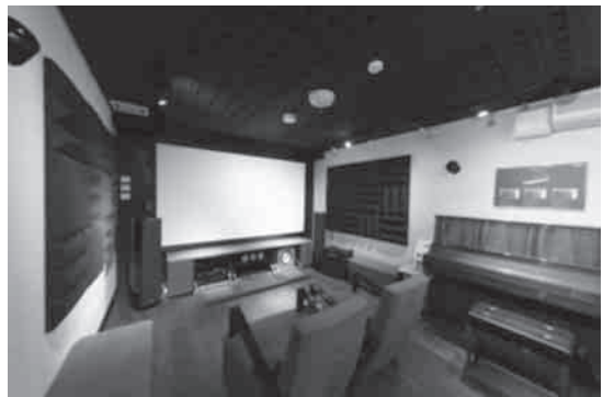
写真5 プレミアム★★★防音室

また、3種類の部屋の室内音響は「一般仕上げ」「ライブ気味(響きが適度に長い状態)」「デッド気味(響きが適度に短い状態)」に分かれており、それぞれの部屋で同じ音を出した際の室内音響の違いも体感しました。