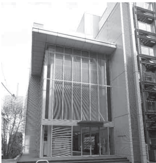
写真1 吉野石膏(株)虎ノ門ビルの外観

〈吉野石膏の最新技術と情報の発信基地〉である吉野石膏虎ノ門ショールームは、虎ノ門ヒルズの直ぐ近くに立地する吉野石膏虎ノ門ビルの1階と2階に設置された施設です。